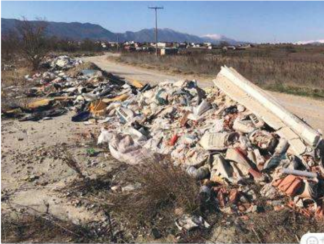
Ова губре и градежан шут е на влезот во Општина Карпош